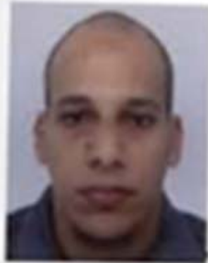
Chérif KOUACHI né le 29/11/1982